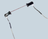
Emniyet fotoseli (standart)