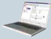
Tek merkezden kontrol "manulink"